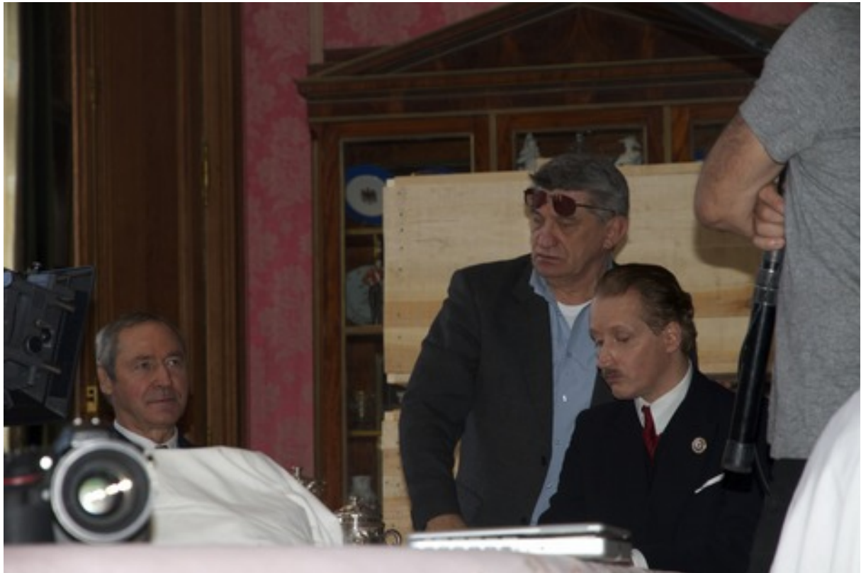
Tournage du film « Francofonia » d'Alexandre Sokourov à Sourches, octobre 2013.

Episode relaté dans le film de Alexander Sokourov, Francofonia , tourné en partie à Sourches, beaucoup au musée du Louvre et présenté à la Mostra de Venise en 2015.