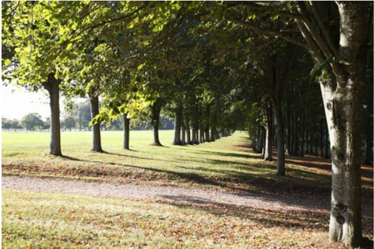
Une des grandes allées de tilleuls

C'est ce Louis-François 1 er l'auteur du fameux journal « Mémoires du marquis de Sourches » qui d'octobre 1681 à la fin de l'année 1712, raconte jour après jour le règne de Louis XIV. Il avait épousé la fille du comte de Montsoreau et par la suite, selon une pratique nobiliaire fréquente sous l'ancien régime, le fils aîné des marquis de Sourches portera le titre de comte de Montsoreau..