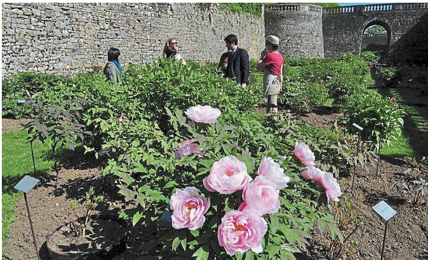
Saint-Symphorien, avril 2017. Au fil des saisons, le conservatoire de la pivoine prend davantage de volume et laisse éclater les couleurs tout au long du mois de mai.

La future épouse du prince Harry est, semble-t-il, passionnée par la pivoine. C'est sa fleur préférée et elle devrait être très présente le 19 mai, le jour du mariage. Pour l'occasion, le château de Sourches retransmettra sur grand écran et en direct le mariage du prince Harry. Le même week-end, 19 et 20 mai, une vente de