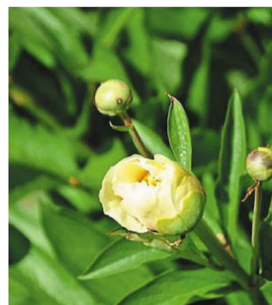
Plus de 2 000 pivoines sont prêtes à fleurir.