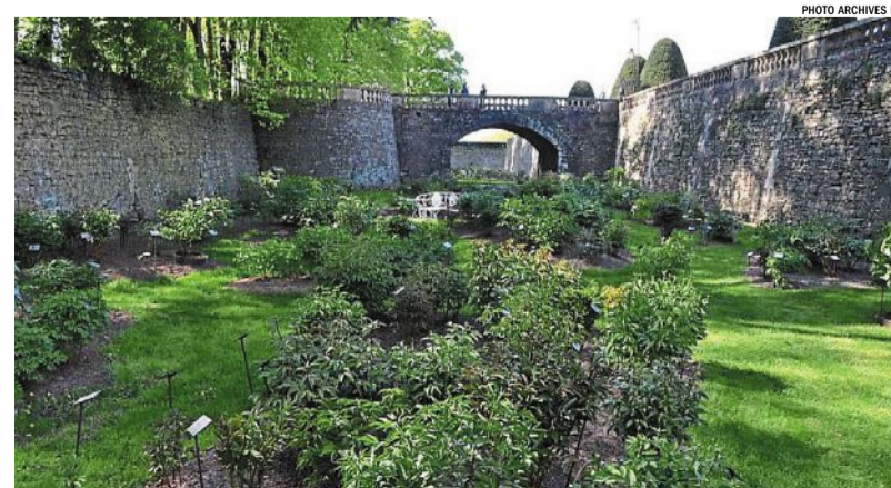
Dans les douves médiévales, le conservatoire donne une nouvelle vie aux abords du château.