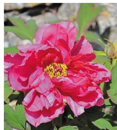
La floraison de la pivoine ne dure que quelques semaines.

Visites aux mêmes horaires que le conservatoire de la pivoine (lire ci-dessus).