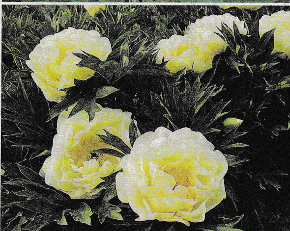
Quatre variétés de pivoines (de haut en bas et de g. à dr.): Coral Sunset, Anemoniflora, Itoh Julia Rose et Itoh Lemon Dream.